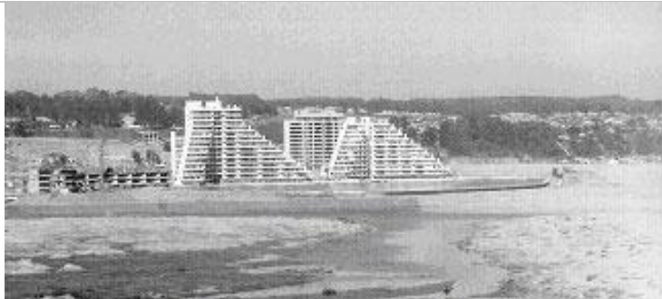
Fig.6. Megaproyecto turístico de segunda vivienda "San Alfonso del Mar", Algarrobo (al fondo Algarrobo tradicional). Sección de conjunto vacacional en construcción; el proyecto incluye una laguna artificial deportiva junto al océano Pacífico. Superficie del terreno: 25 Hás. en zona de playa y 56 Hás. en zona de cerro.