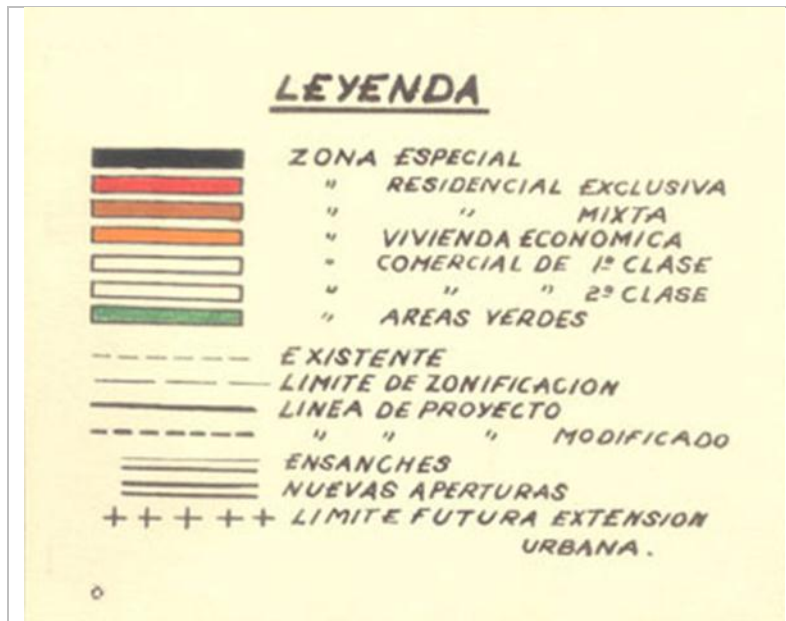
Fig.7. Detalle de cuadro de simbología del Plano Oficial de Urbanización de Algarrobo 1950.