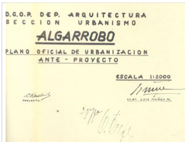
Fig.8. Detalle del V°B° de Luis Muñoz Maluschka del Plano