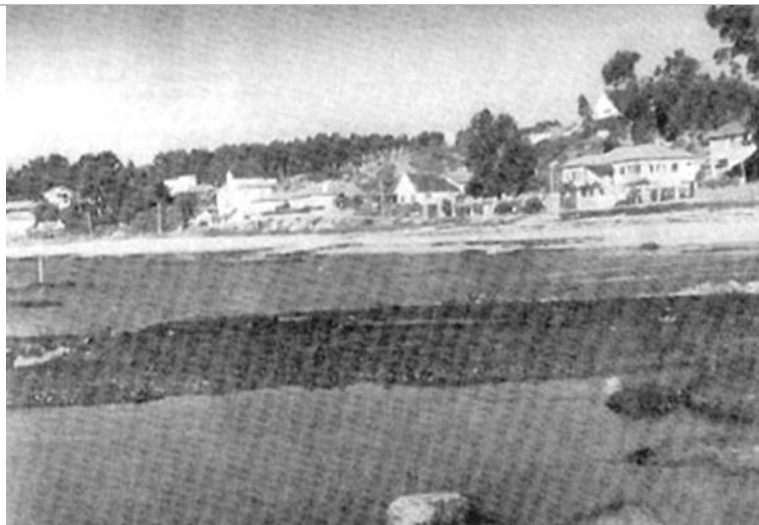
Fig.5. Vista de Algarrobo, balneario de la Provincia de Santiago, circa 1956. Fte.: EMPRESA DE FERROCARRILES DE ESTADO, Sección de Propaganda y Turismo: Guía del veraneante. Guía Anual de Turismo de la República de Chile . Santiago, 1957, 360 págs.