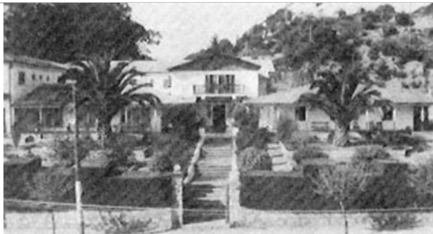
Fig.3. Fotografía del "Hotel de Pacífico", balneario de Algarrobo, Provincia de Santiago, circa 1957.

Creemos que el territorio debe entenderse esencialmente como un bien común, pues contiene significados y relaciones con las comunidades que no pueden ser reducidos a mercaderías transables, tales como los servicios ambientales, los valores culturales, sentimientos de pertenencia e identidad cultural.