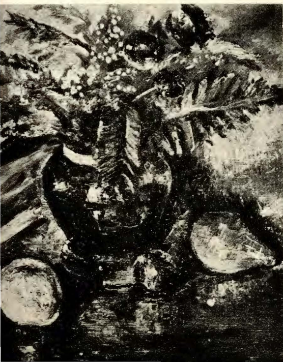
Julio Ortiz de Zárate.—Naturaleza muerta.

en nuestro país, pueden aún hablar de pintura, ellas son: Una considerable variedad de temperamentos que se esfuerzan por manifestarse en forma personal, desarrollando sus propios medios; en general, una saludable tendencia hacia lo plástico, es decir, una comprensión siempre mayor del poder expresivo de los elementos plásticos y un mayor aprovechamiento emotivo de ellos. Como consecuencia lógica de un apreciable desarrollo conceptual, nuestros artistas van impregnándose progresivamente del espíritu del artífice, trabaja sus